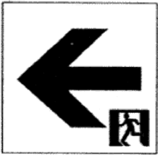
室内通路誘導灯 (一方向)